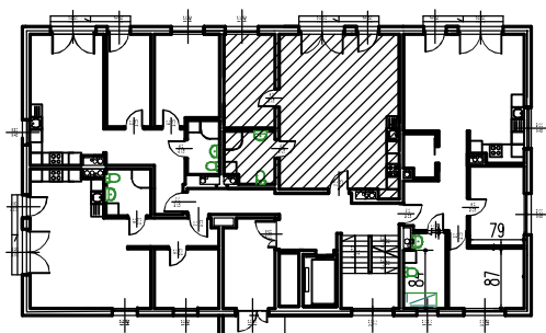
LOKALIZACJA MIEJSCA POSTOJOWEGO